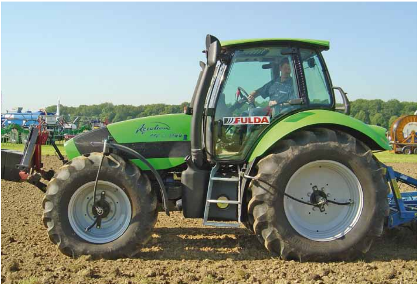
AIRBOX/drive 2L – Deutz Agrotion 2-Leiter-Reifendruckregelsystem für alle Ackerschlepper